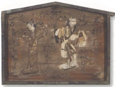
大原神社蔵 絵馬「踊り子図」 （福知山市有形民俗文化財）