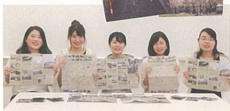
散策マップを手に笑顔のゼミ生