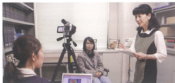
大学院生と学部生との共同研究：サーモグラフィーを用いた実験風景