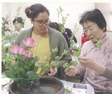
各クラブで日本の文化を体験しました。華道部・剣道部・弓道部