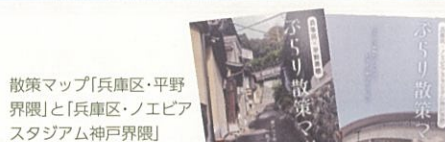
散策マップ「兵庫区・平野界限」と「兵庫区・ノエビアスタジアム神戸界限」

歴史や産業遺産からグルメに至るまで、既存の価値観にとらわれず、さまざまな情報を発信する新しい感覚の散策マップを作るという観点から、兵庫区域住民以外の若者の視点を取り入れることになり、住生活文化学が専門の砂本教授に兵庫区役所から協力を依頼されこのコラボレーションが始まりました。同研究室のゼミ生3・4年生9名と国立明石工業高等専門学校 専攻科建築・都市システム工学専攻で同教授が