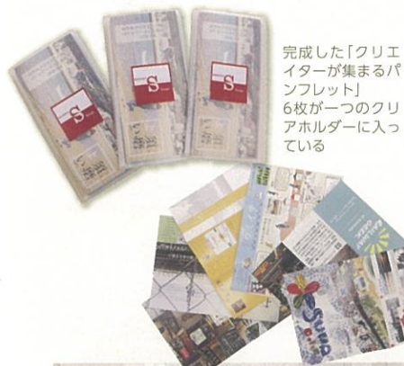
完成した「クリエイターが集まるパンフレット」6枚が一つのクリアホルダーに入っている

家政学部家政学科の平成29年度後期の授業「都市デザイン演習」(担当：梶木 典子教授)の受講生29名が、地元の須磨浦の活性化のために個性溢れるクリエイターたちに集まってほしいという願いのこもったパンフレット「クリエイターが集まるパンフレット」を作成しました。この授業では、多様化している都市の課題に向き合い、そこに暮らす人びとの生活を魅力あるものにするために今後の都市のあり方を考えています。